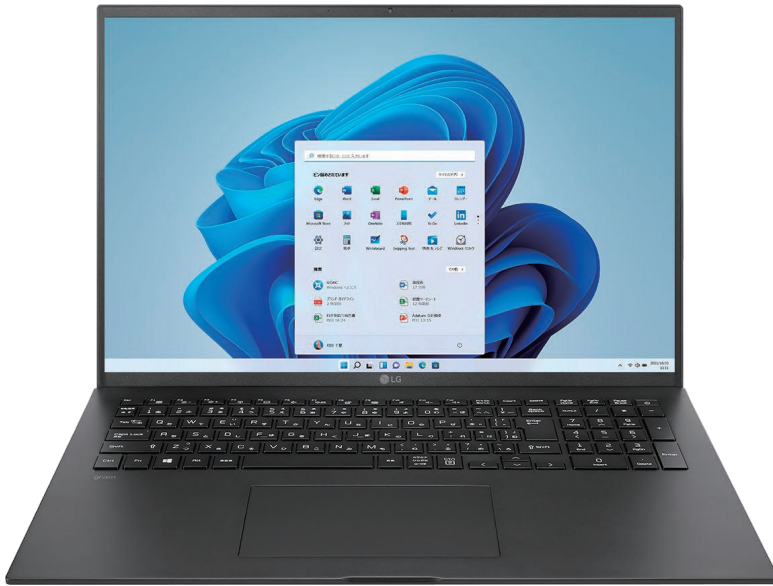
17インチビジネスモデル 17ZB90R-NP55J