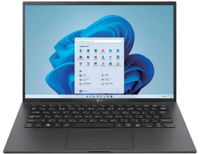
14インチビジネスモデル 14ZB90R-NP55J